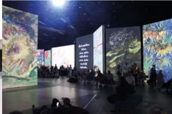
Van Gogh Alive tunnelmaa.