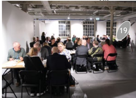
Näihin kuviin, näihin tunnelmiin. PIRA-päivästä jäi taas hyvä maku.