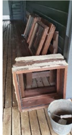
Vanhat pois ja uutta tilalle.