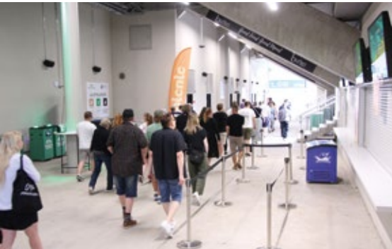
Tammelan stadion kierrettiin sisältä ja ulkoa, sekä saatiin esittely ja lounas.

tiloihin. Stadionin esittelyn jälkeen nautittiin maittava lounas Tammelan stadionin ravintolas- sa. Stadionilta käveltiin Tamperetaloon, jossa päivän ohjelmaan kuului vierailu Van Gogh Alive -immersiiviseen mieleenpainuvaan taide-elämykseen.